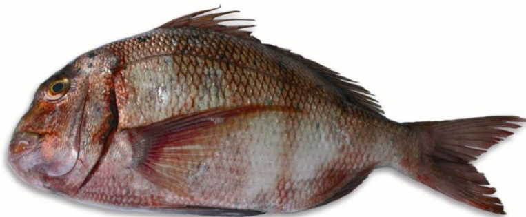
Sama roquera adulta

Nombre científico: Pagrus auriga (Valenciennes, 1843)