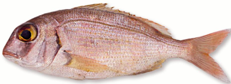
Bocinegro o pallete

Nombre científico: Pagrus pagrus (Linnaeus, 1758)