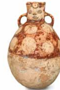
Vasija cerámica globular Cultura Chancay (1200-1470 d.C.) Costa central, Perú

se acerquen a ellas. La Casa de Colón trabaja con el objetivo de revertir en la sociedad unos recursos públicos cuyo valor excede el meramente económico para convertirlo en un valor social y cultural para nuestro patrimonio.