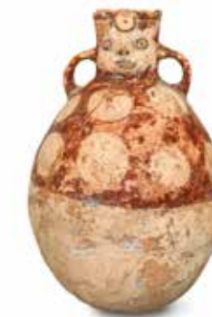
Vasija cerámica globular Cultura Chancay (1200-1470 d.C.) Costa central, Perú

se acerquen a ellas. La Casa de Colón trabaja con el objetivo de revertir en la sociedad unos recursos públicos cuyo valor excede el meramente económico para convertirlo en un valor social y cultural para nuestro patrimonio.