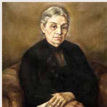
Retrato de mi madre