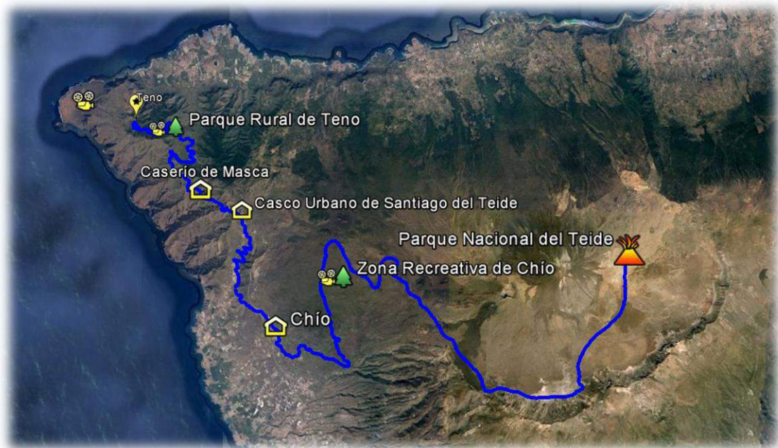
Imagen 3: Ruta del Oeste