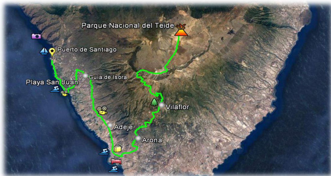
Imagen 4: Ruta del Sur