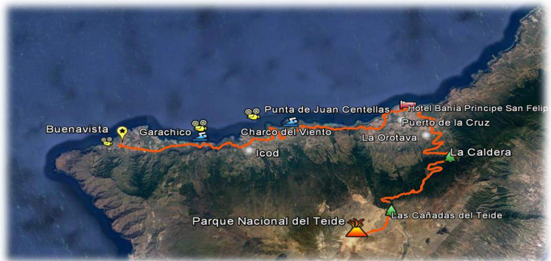
Imagen 2: Ruta del Norte