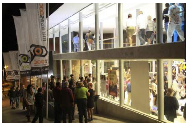
Exterior del Auditorio de Guía de Isora en la inauguración de la edición de 2012 de MiradasDoc.

Debido al progresivo auge de la no ficción en el contexto internacional del cine contemporáneo, el festival ha contado con una programación cuidada (sección internacional, ópera prima, nacional y canaria), secciones paralelas (más abundantes los primeros años antes de la fase más dura de la crisis), actividades educativas, invitados, etc. Destaca también la celebración paralela del Mercado de cine documental (dirigido por el cineasta y gestor David Baute), donde acuden compradores nacionales e internacionales (distribuidores, programadores de TV, etc.).