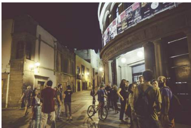
Ambiente exterior del Teatro Guiniguada antes de una de las sesiones del LPGCC en 2014. (Imagen: LPGCC).

Ya en 2014 y como «entrante» del Festival de cine de Las Palmas aparece el MMF — Monopol Music Festival para documentales musicales o sobre música, complementado con conciertos en vivo, dirigido por Víctor Ordóñez. En 2015 comienza a itinerar por Vecindario y La Laguna, y es un antecedente claro del Docurock.