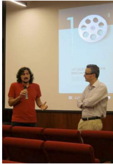
El director de cine argentino Lisandro Alonso durante un coloquio de la Muestra Ibértigo en 2012. (Imagen: Asociación de cine Vértigo).

Cine. Por otro lado, Teodoro Ríos puso en marcha desde 1999 hasta 2005 los Screenings de cine español de Lanzarote, una reunión (de hecho las primeras ediciones se llamaban «Encuentros» en lugar de «Screenings») de tres días dirigido fundamentalmente a profesionales del cine y medios de comunicación para el visionado y compra de películas para diferentes mercados y ventanas de exhibición, aunque se completaba con proyecciones y preestrenos públicos de algunos largometrajes.