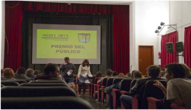
Jornada de clausura de la MIDEC 2015 con recuento del voto del público en el Salón de Actos de la Facultad de Educación de la ULL.

Es interesante constatar, así mismo, cómo más allá de este sector público o semipúblico, diferentes instituciones culturales independientes se suman a la fiebre de los festivales de cortometrajes. Nos referimos en estos casos al denominado Tercer sector, es decir, el ámbito asociativo (organizaciones privadas sin fin de lucro y con vocación de servicio ciudadano), diferentes del sector público (administraciones como ayuntamientos, cabildos, gobiernos regionales) y del sector privado con ánimo de lucro (empresas). Se trata de muestras como la del Instituto de Estudios Hispánicos o la de San Rafael en corto que se comentan en el punto 7 de este artículo. Como festival propiamente dicho, tenemos a la Asociación Cultural para el Fomento y Desarrollo de la Lectura y el Cuento que organiza el Festival Internacional del Cuento de Los Silos desde 1996. En 2005 crea una sección independiente que denomina Festival Internacional de Cortometraje Cuentometraje, que se celebra en el vecino municipio de Buenavista del Norte y que será dirigido por David Baute (quien posteriormente y como hemos visto sería el responsable del Mercado de MiradasDoc y del FICMEC). Estaba especializado en cortos basados en cuentos, con categorías de ficción y animación, además de un premio del público, en los tres casos con dotación económica. Sin embargo, solo tuvo 5 ediciones, siendo la última en 2009.