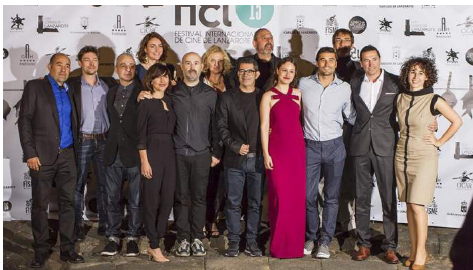
Foto de familia de Festival de cine de Lanzarote de 2015, entre otros, con los actores Javier Cámara, Aida Folch y Alex García.

En el mismo 2006 arrancó en Fuerteventura el Dunas — Corto Festival de Cine y vídeo / Festival de cortometrajes de Fuerteventura, organizado por el Ayuntamiento de Corralejo y dirigido por Miguel Díaz. Como en el caso del Festival de Arona — Playa de las Américas, el certamen contaba con diferentes categorías según las especialidades de los departamentos de cine, además de un premio a mejor corto canario, y contaba con abundantes galardones económicos y ayudas al traslado y estancia. Sin embargo, como en otros casos, sufrió importantes recortes de financiación, que le llevaron a plantear en 2011 una edición especial de transición sin premios, formato que se repitió en 2012, finalmente el último evento realizado.