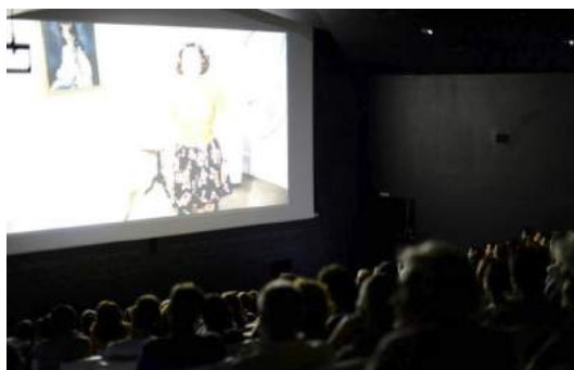
Sesión de proyección del Tenerife shorts en 2013 en la sala del TEA. (Imagen: Tenerife shorts).

Con un formato más clásico, en octubre de ese 2013, comenzó en Gran Canaria el FIC Gáldar — Festival Internacional de Cine de Gáldar. Dirigido por la actriz Ruth Armas a través de la empresa OMF Asesores SLP, cuenta con una sección competitiva más genérica y sobre todo nacional de cortometrajes, además de otra de rodajes in situ (Gáldar Rueda), y una pequeña sección informativa con la presentación de largometrajes nacionales, además de pasacalles, muestra de cineastas grancanarios e infantiles y hasta desfiles de moda. De hecho es un festival que, como el de Lanzarote, concede mucha importancia a toda esa parte de glamour , invitados y photocall asociada a estos eventos. Por ejemplo, para asistir a la gala de clausura del 2015, desde la organización se hacían mensajes de este tipo: «IMPORTANTE: Recuerda venir vestido para la ocasión. El código de vestimenta será formal o cóctel» 24 .