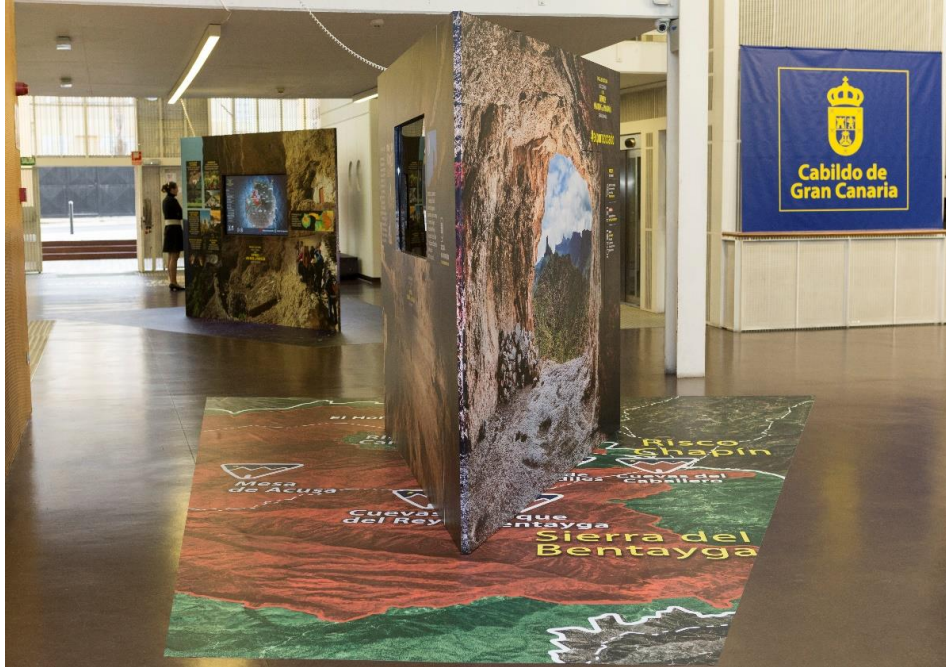
Foto 1: Vista general de la exposición del Patrimonio Mundial en la Sede Institucional.

CONSEJERÍA DE GOBIERNO DE PRESIDENCIA Instituto para la Gestión Integrada del Patrimonio Mundial y la Reserva de la Biosfera de Gran Canaria 03.0.11