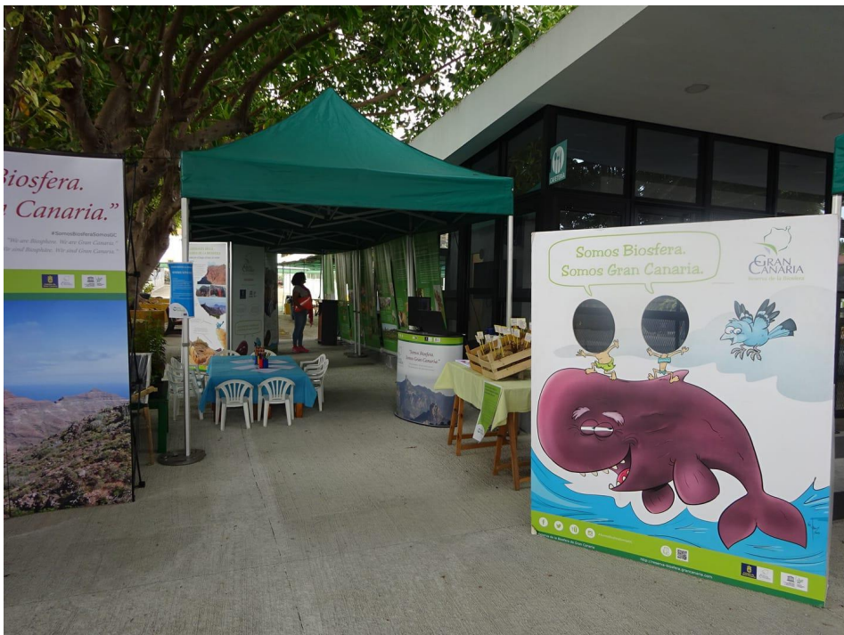
Foto 2: Vista parcial de la exposición de la Reserva de la Biosfera de Gran Canaria.